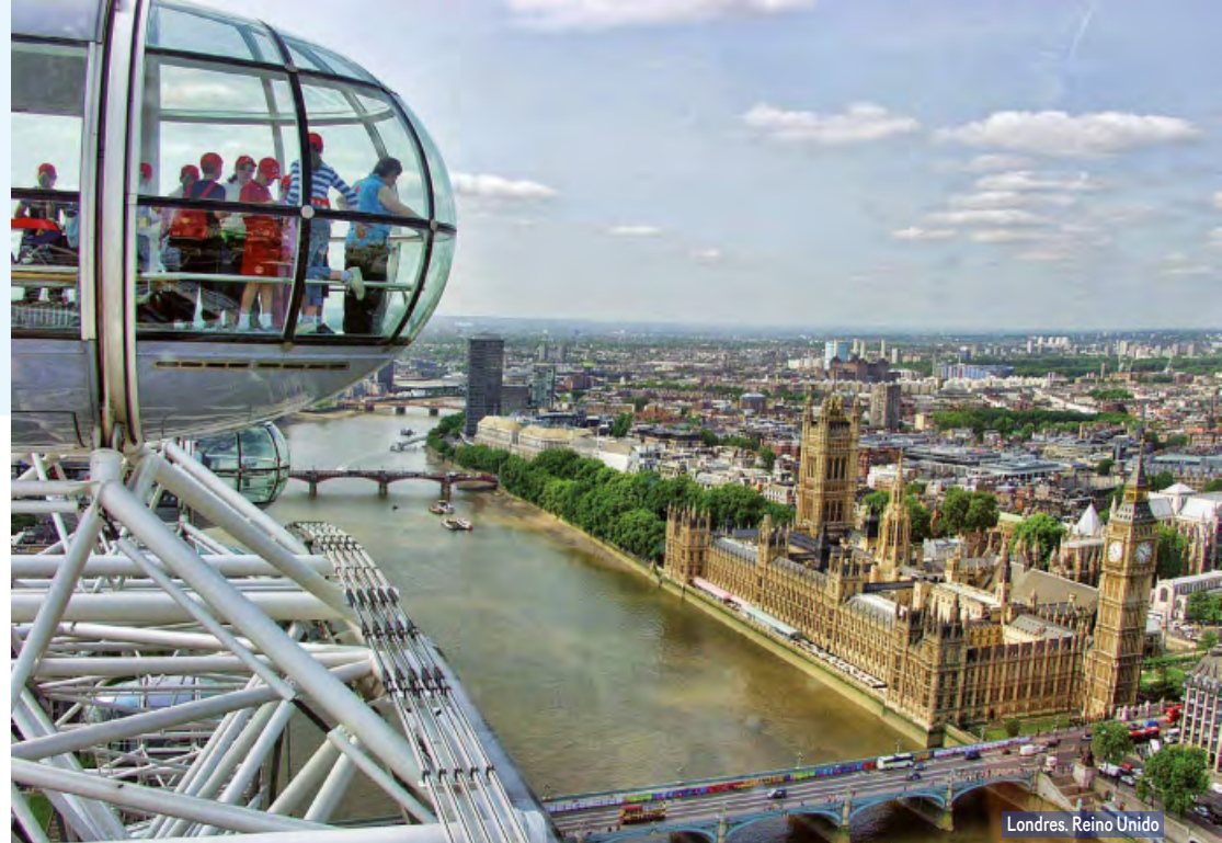
Londres, Reino Unido

Alojamiento y desayuno. Por la mañana visita panorámica de la Ciudad Luz para conocer sus lugares más emblemáticos como la Place de la Concorde, Arco del Triunfo, Campos Elíseos, Isla de la Ciudad con la imponente Iglesia de Notre Dame, Palacio Nacional de los Inválidos donde se encuentra la tumba de Napoleón, con breve parada en los Campos de Marte para fotografiar la Torre Eiffel. Por la tarde, recomendamos realizar nuestra excursión opcional, visitando el barrio de Montmartre o barrio Latino.