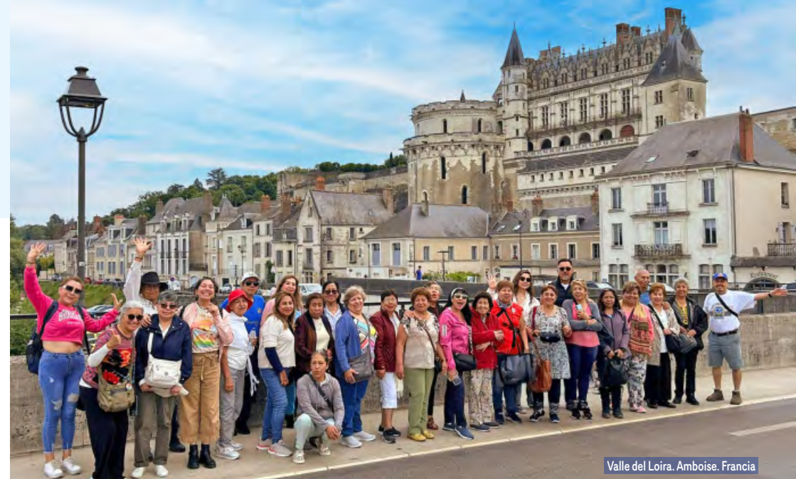
Valle del Loira. Amboise. Francia

Alojamiento y desayuno. Por la mañana visita panorámica de la Ciudad Luz para conocer sus lugares más emblemáticos como la Place de la Concorde, Arco del Triunfo, Campos Elíseos, Isla de la Ciudad con la imponente Iglesia de Notre Dame, Palacio Nacional de los Inválidos donde se encuentra la tumba de Napoleón, con breve parada en los Campos de Marte para fotografiar la Torre Eiffel. Por la tarde, recomendamos realizar nuestra excursión opcional, visitando el barrio de Montmartre o barrio Latino.