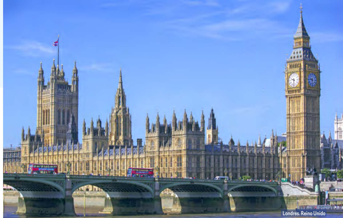
Londres. Reino Unido