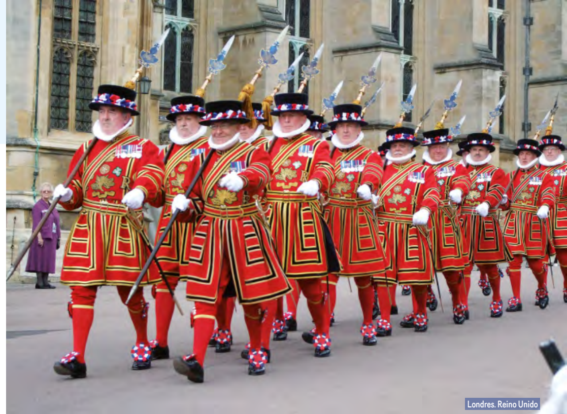
Londres. Reino Unido

Desayuno. Salida hacia Rotemburgo. Tiempo libre para admirar esta bella ciudad medieval que conserva sus murallas, torres y puertas originales, contemplar sus típicas calles y la antigua arquitectura germana. Continuación a través de la Ruta Román-