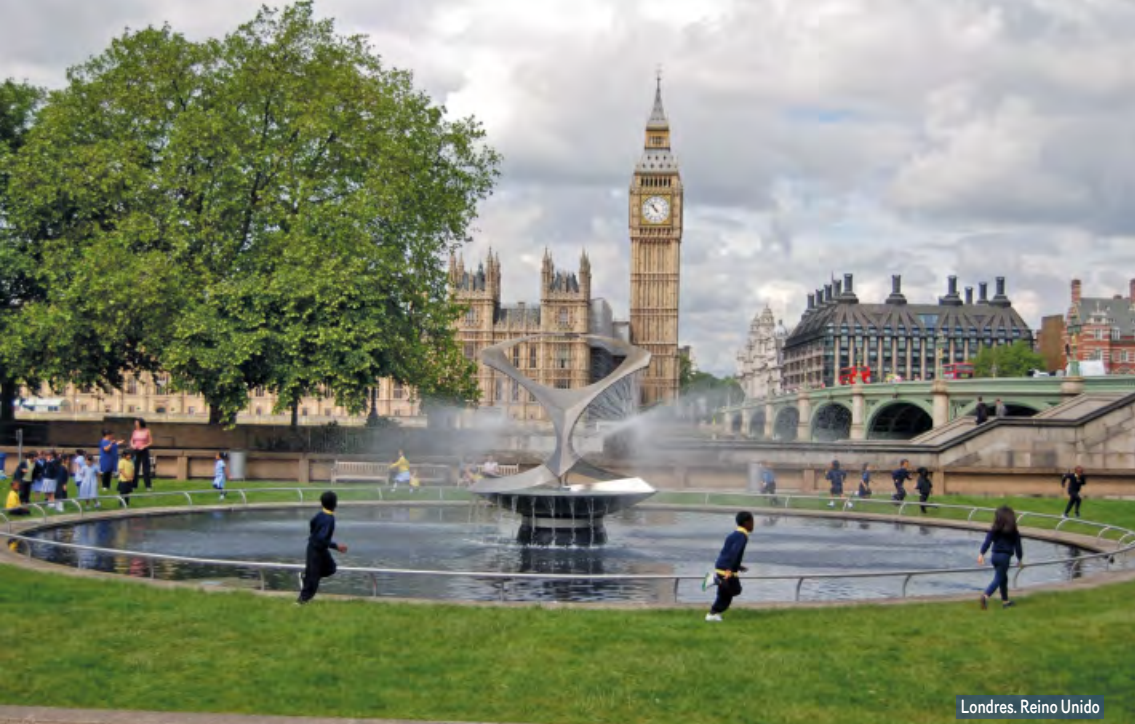
Londres. Reino Unido

Continuación hacia Florencia, capital de la Toscana y cuna del Renacimiento. Alojamiento.