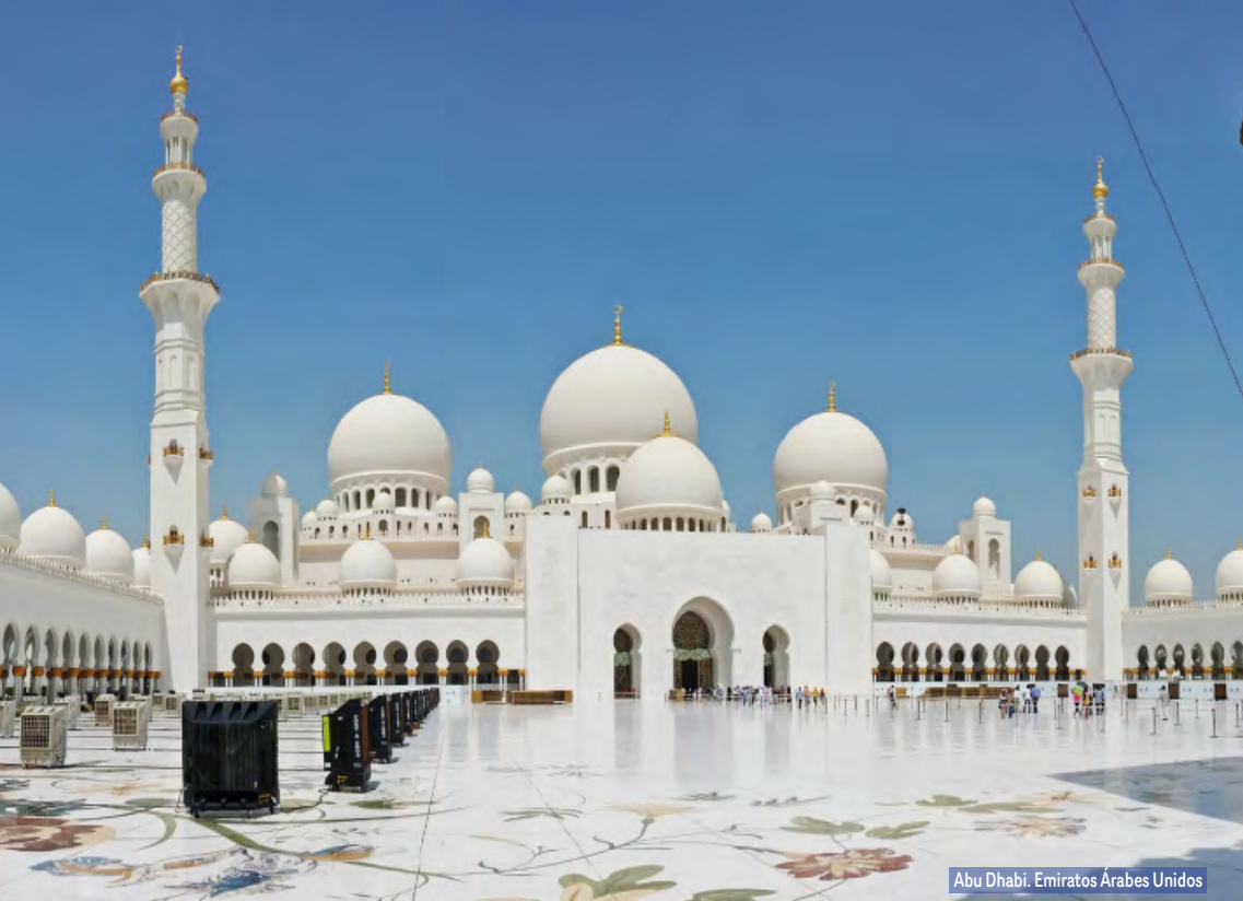
Abu Dhabi. Emiratos Árabes Unidos

Árabe, y el antiguo arte de la Danza del Vientre. Sobre las 21:30 hrs regreso al hotel. Alojamiento.