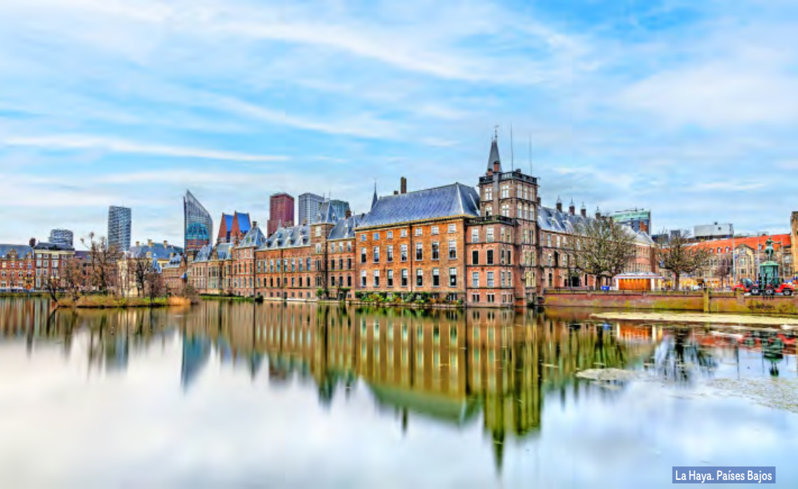
La Haya. Países Bajos