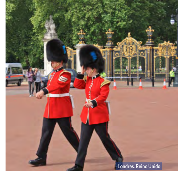
Londres. Reino Unido